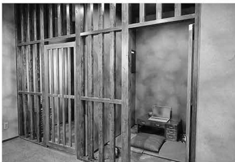
牢屋風のWEB会議スペース

びつけて紹介するもの。働き方の変化を促し、事業者の発展と地域創生につなげることを目標としている。ツアーでは牢屋風のWEB会議スペースや隠し扉の先のミーティング室など、忍者屋敷をテーマにデザインされたオフィスを見学でき、参加者は楽しみながら、IT導入の事例やリノベーションによるブランディングの向上などについて学べ