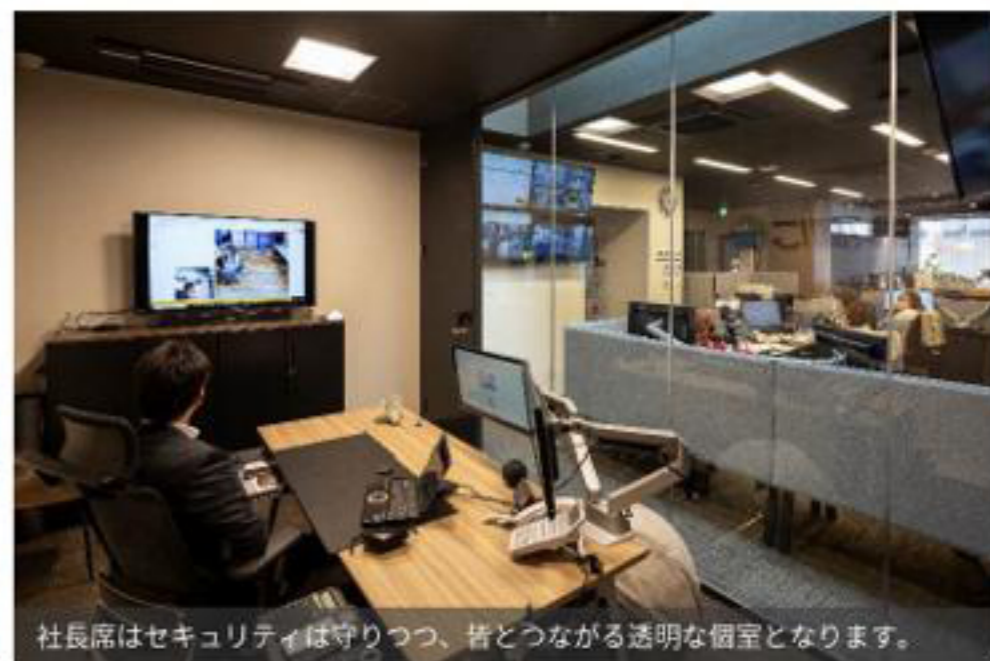
社長席はセキュリティは守りつつ、皆とつながる透明な個室となります。