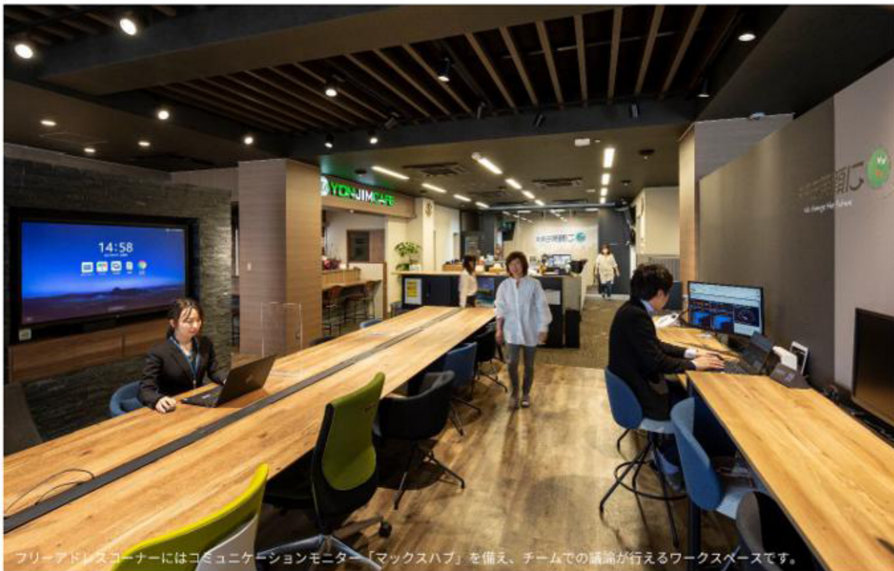
フリーアドレスコーナーにはコミュニケーションモニター「マックスハブ」を備え、チームでの議論が行えるワークスペースです。

業種 : 電気機械器具卸売業 規模 : 600㎡ 30名 納入年月 : 2020年4月 リニューアル 提供内容 : PM 空間設計、家具納品