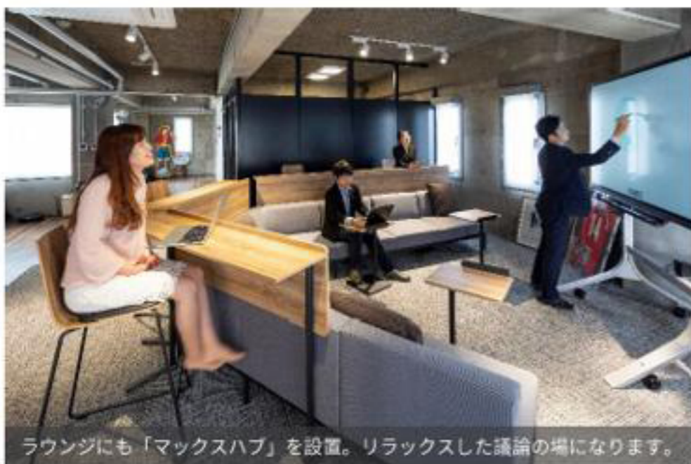
ラウンジにも「マックスハブ」を設置。リラックスした議論の場になります。