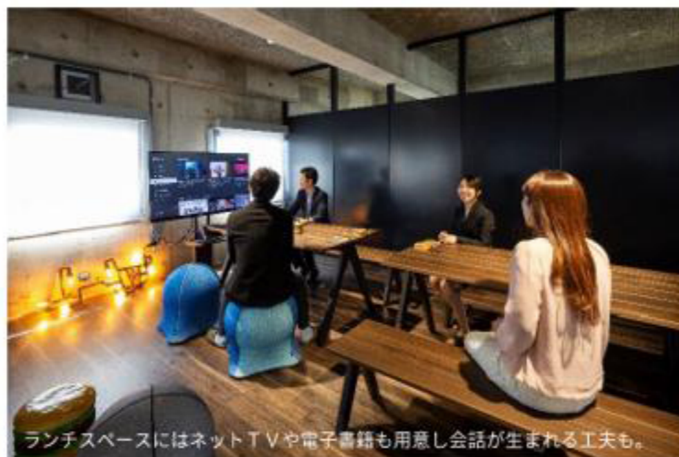
ランチスペースにはネットTVや電子書籍も用意し会話生まれる工夫も。